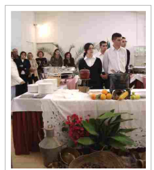
Com a colaboração de alunos da Escola de Hotelaria de Portimão, foram servidos vários pratos"

Participaram nesta edição 10 restaurantes de toda a Freguesia cujos responsáveis, no final da semana, fizeram uma avaliação positiva deste evento, realçando ser "o melhor de sempre".