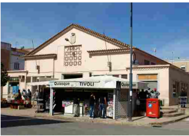
"Foram feitos alguns melhoramentos no Mercado Municipal"

Enquanto se aguarda a tão necessária intervenção de fundo no Mercado Municipal de Messines, que a Câmara Municipal se comprometeu a realizar, a Junta decidiu tomar algumas medidas no sentido de resolver alguns problemas de segurança e higiene no trabalho. Foi adquirida uma máquina de limpeza industrial para o Mercado e acessórios de higiene para as casas de banho e edifício, apropriados para o uso em espaços públicos. Na casa de banho das senhoras foi feita uma intervenção a nível dos esgotos e no pavimento.