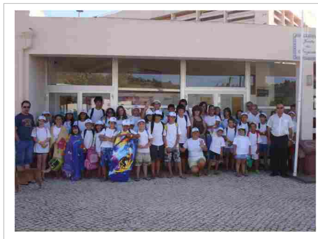
"Grupo de crianças e animadores voluntários"

No caso dos idosos, mereceu especial atenção a questão da sua segurança em casa, pelo que foi dado apoio à palestra realizada pela GNR, nas instalações da Junta de Freguesia.