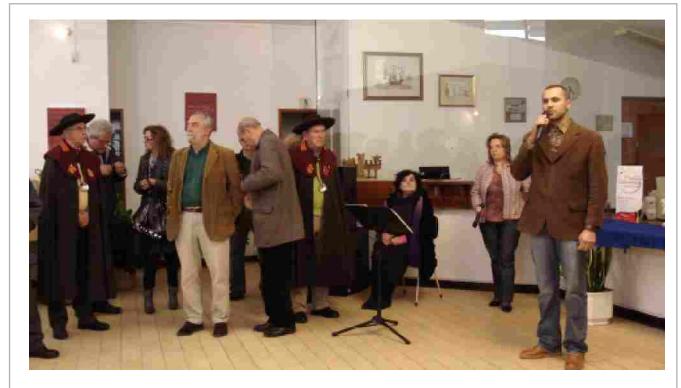
"Na inauguração da 5ª edição, o presidente deu as boas vindas e agradeceu os apoios"

Entre os dias 27 de Novembro a 5 de Dezembro de 2010, a Junta organizou a já famosa Semana Gastronómica da Freguesia de Messines . A comida serrana ganha, de ano para ano, cada vez mais adeptos, que procuram a nossa freguesia à procura de pratos e doces regionais, regados com bom vinho algarvio e acompanhados com um variado programa de animação musical que vai percorrendo os restaurantes que aderem a esta iniciativa.