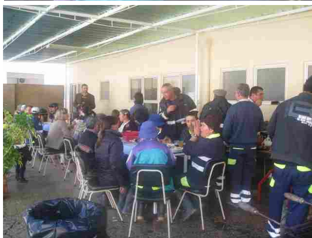
"Almoço de Natal"