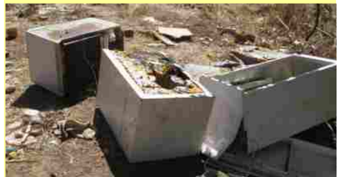
“Não abandone os monos na rua”

A Junta criou também um serviço de recolha de monos e verdes ao domicílio, com o custo de 10€ na Vila e de 20€ na restante freguesia.