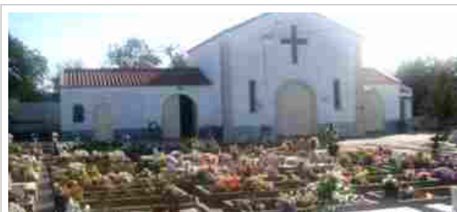
"Foram feitas obras no cemitério"

Foram também criados novos serviços de ornamentação e embelezamento de sepulturas, que podem ser solicitados na Junta.