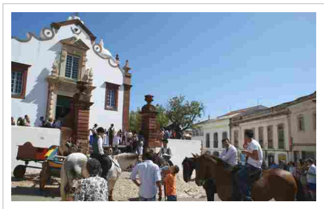
"Os cavaleiros frente à Igreja Matriz"

Esta iniciativa surgiu na sequência de uma série de reuniões que o executivo da Junta promoveu com as associações com o intuito de conceber e organizar um evento que promovesse a Freguesia e o trabalho inter-associativo e trouxesse animação e visitantes à Vila, dinamizando o comércio local. Dos encontros realizados resultou a " Festa das Tradições de S. Bartolomeu de Messines ".