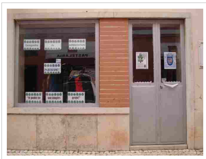
"Um espaço aberto à solidariedade dos messinenses"

Ainda no Natal, destaca-se a tradicional distribuição de 60 Cabazes de Natal, por funcionários da Junta e famílias carenciadas, com o apoio do Supermercado Guerreiro e Prata.