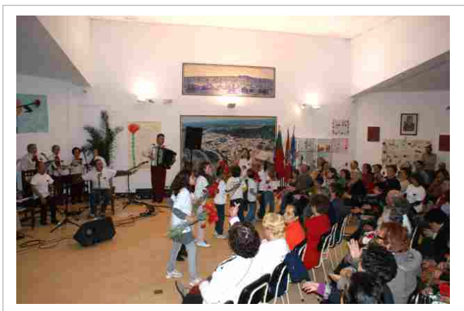
"Revivendo o 25 de Abril, com a oferta de cravos vermelhos"

No final do espectáculo, várias crianças distribuíram cravos vermelhos pelos presentes, revivendo todo o simbolismo da data e da flor. Esteve patente ainda uma exposição sobre o 25 de Abril que reuniu pinturas de crianças das escolas EB1 da Freguesia, Jardim de Infância, Casa do Povo e Jardim-Escola João de Deus.