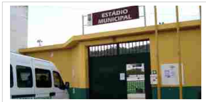
“A Junta apoia as classes jovens da UDM”

É de destacar o importante contributo financeiro, no valor de 12 mil euros, que a Junta atribuiu à União Desportiva Messinense, como forma de apoiar a continuação deste clube e as suas classes de futebol jovem e infantil. Também a Casa do Povo de S. Bartolomeu de Messines, que tem em funcionamento diversas modalidades desportivas, recebeu um apoio financeiro de 6 000 Euros, complementados, ao longo do ano, com outros apoios pontuais.