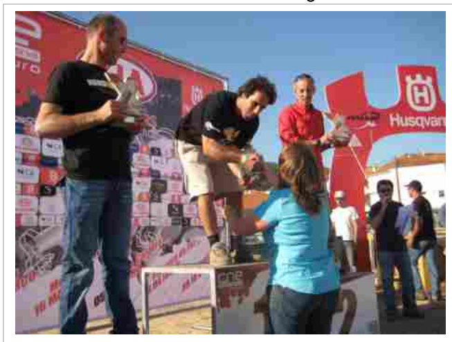
“Entrega de prémios na prova de motociclismo da ExtremoSul”

A Junta tem vindo a dar todo o apoio possível aos clubes e entidades que promovem a actividade física e o desporto, entendido como uma componente fundamental para o desenvolvimento da pessoa e promotor do bem estar físico e psicológico. Desde a Caminhada Nocturna, promovida pela Câmara Municipal de Silves, à Taça de Lutas Amadoras, da Casa do Povo de Messines, às provas da Extremo Sul, a Junta tem procurado formas de colaborar no sentido de fomentar estas iniciativas na nossa freguesia.