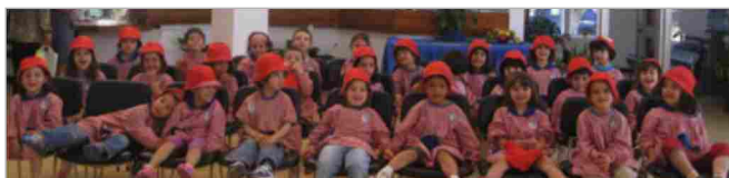
"Em actividades na Junta"