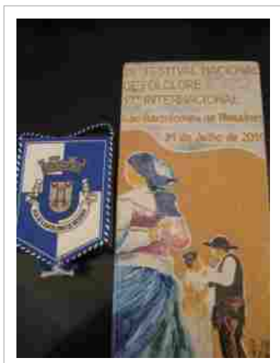
“A oferta de lembranças a grupos participantes em actividades é um dos apoios concedidos”