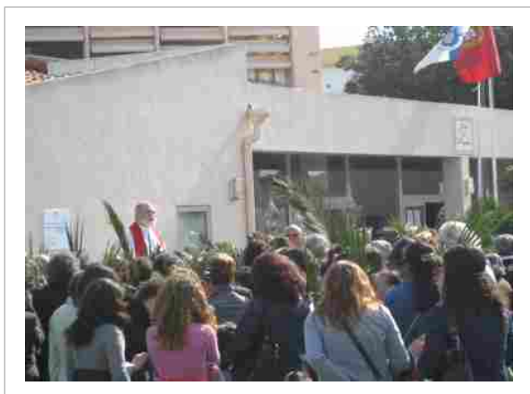
“A Junta apoiou as festividades do Domingo de Ramos”