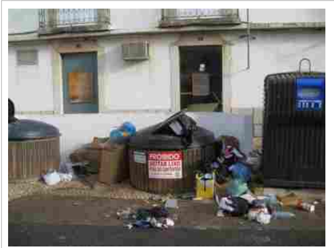
“Colabore na limpeza da vila”

A Junta de Freguesia tem vindo a desenvolver várias acções de protesto contra as falhas na recolha de lixo na nossa freguesia, uma situação que piorou depois da Câmara Municipal ter deixado de fazer a recolha aos fins de semana e feriados.