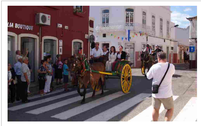
"O cortejo passou pelas ruas da Vila"

Nos dias 18 e 19 de Setembro, decorreu a primeira edição da Festa das Tradições, organizada pela Junta de Freguesia, com o apoio de várias associações locais.