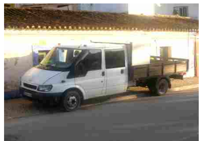
"As novas viaturas da Junta"

Em relação aos funcionários da Junta, destaca-se também a aquisição de fardas de trabalho e equipamentos de segurança para os mesmos que assim, além de se encontrarem identificados, podem desenvolver a sua actividade em melhores condições de higiene.